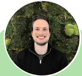
Thomas Afstudeerstage: Sustainability by Design