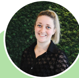
Yana Coördinatie ambassadeursgroep, Lokaal & Impact